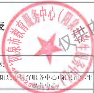
阳泉市市级预算部门（单位）项目支出绩效目标表 (2025年度)