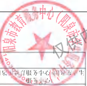
阳泉市市级预算部门（单位）项目支出绩效目标表 (2025年度)