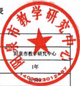
阳泉市市级预算部门（单位）项目支出绩效目标表 (2025年度)