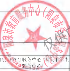
阳泉市市级预算部门（单位）项目支出绩效目标表 (2025年度)