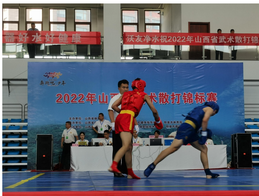
（图为使用体育彩票公益金支持承办山西省武术散打锦标赛的场景）