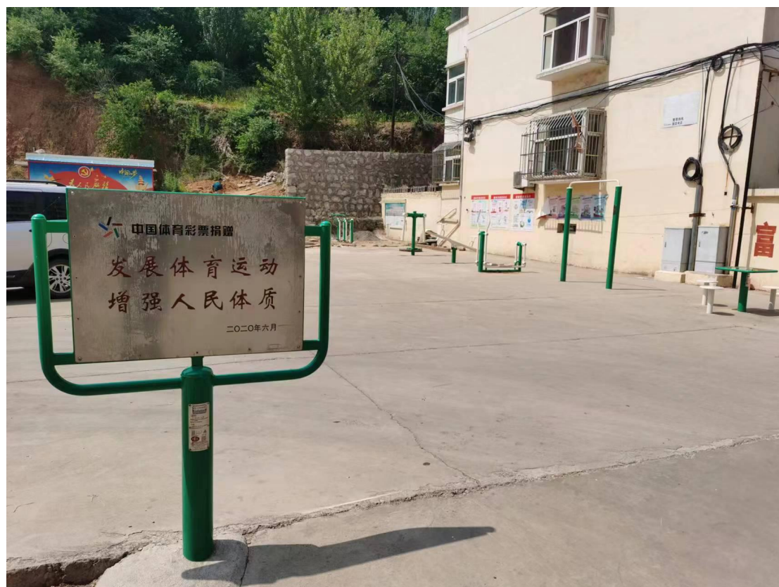
(图为使用体育彩票公益金捐赠阳泉郊区河底镇中佐村全民健身器材)