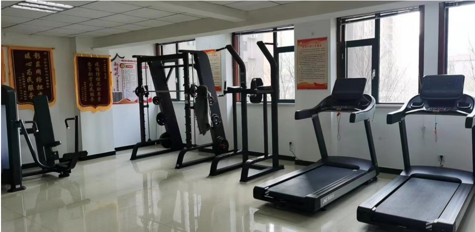
(图为使用体育彩票公益金支持建设百姓健身房)