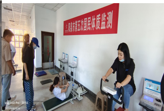
(图为使用体育彩票公益金支持国民体质监测)