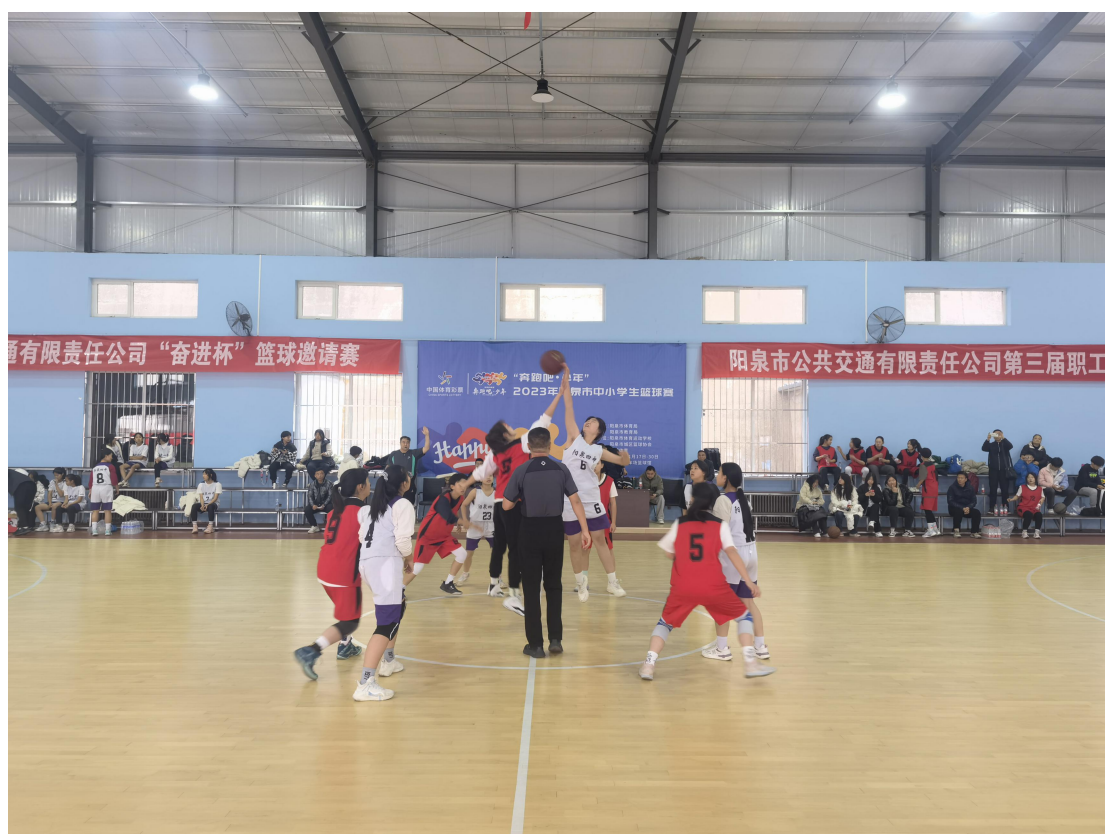
（图为使用体育彩票公益金支持支持青少年赛事活动篮球比赛）