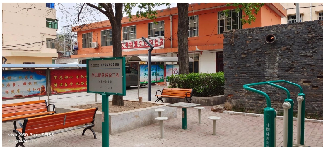
(图为使用体育彩票公益金捐赠阳泉城区义东沟全民健身器材)