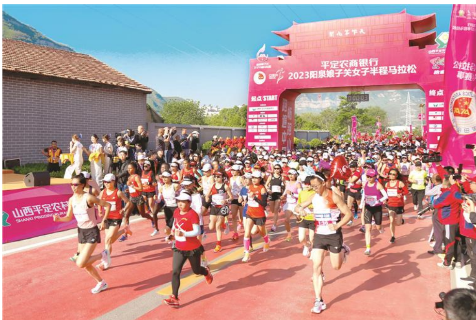
(图为使用体育彩票公益金支持举办 2023 年首届娘子关女子半程马拉松赛)