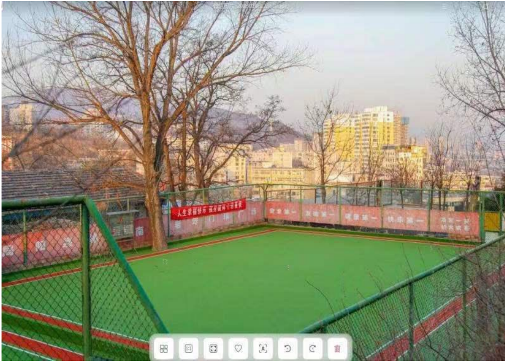
（图为使用体育彩公益金改造后阳泉城区南山公园门球场）