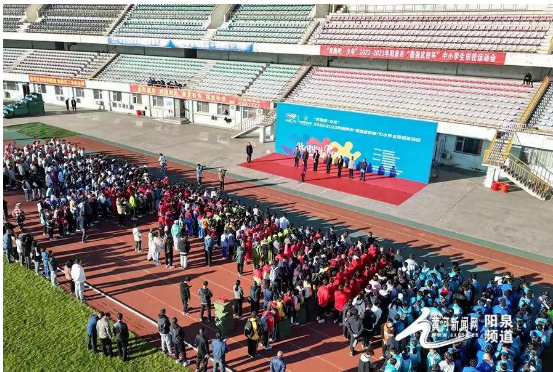
（图为使用体育彩票公益金支持支持青少年赛事活动田径比赛）