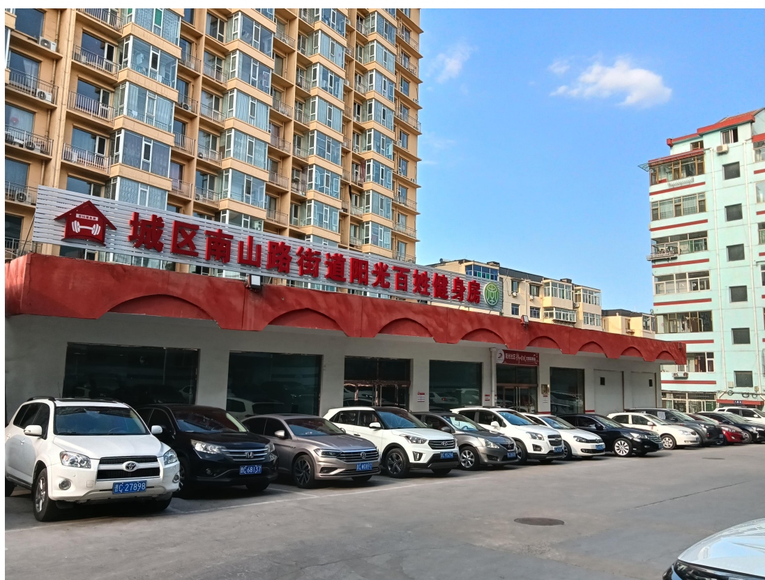
(图为使用体育彩票公益金支持建设百姓健身房)