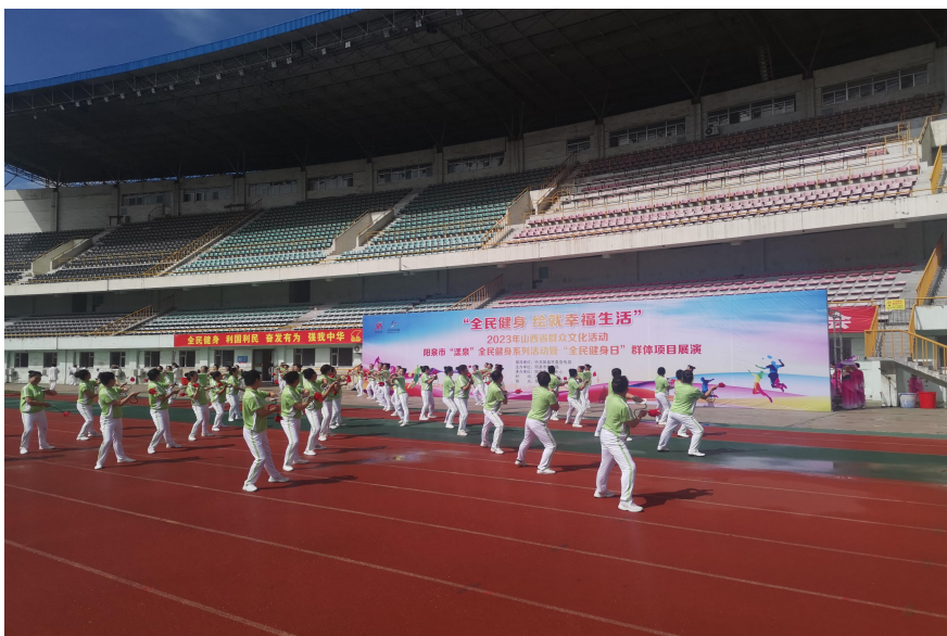
（图为使用体育彩票公益金支持开展全民健身日活动）