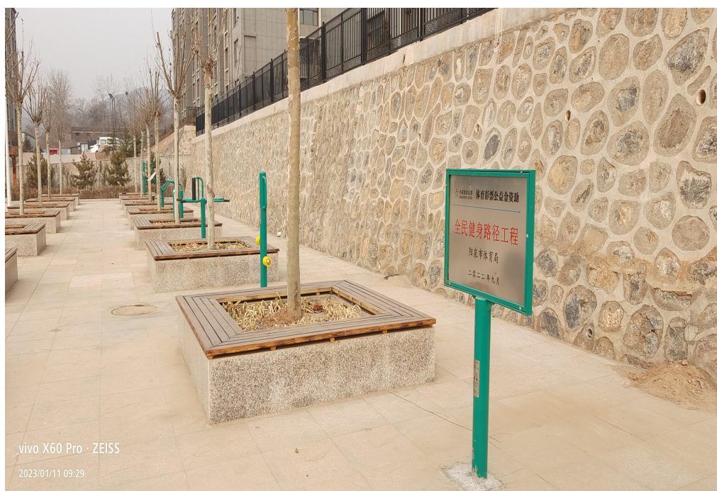
(图为使用体育彩票公益金捐赠阳泉郊区魏家峪全民健身器材)