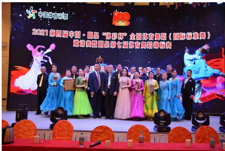
（图为使用体育彩票公益金支持举办全国体育舞蹈比赛）