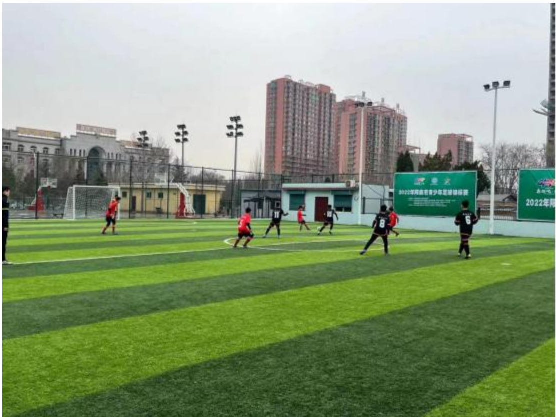
（图为使用体育彩公益金修建的五人制足球场）