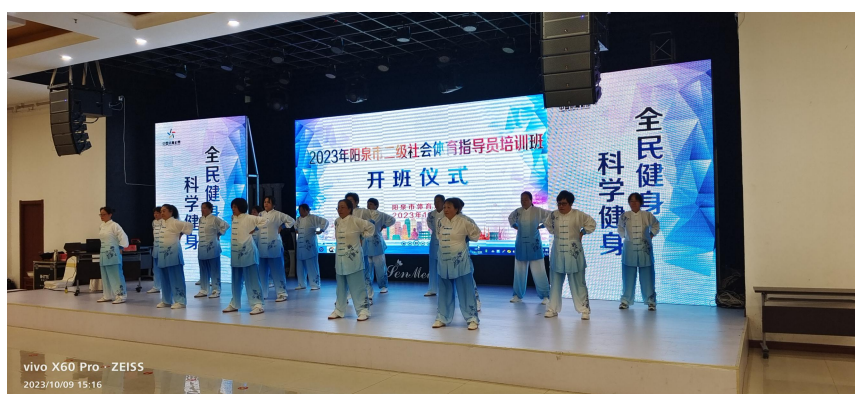
（图为使用体育彩票公益金支持二级社会指导员培训）