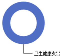
一般公共预算当年拨款结构图

2025年度阳泉市第三人民医院一般公共预算当年支出1,115.61万元,主要用于以下方面：卫生健康支出1,115.61万元,占100.00%等。本年一般公共预算1115.61万元,其中床位补助265万元、传染病区补助469万元、公立医院改革35万元、基本公卫省级补助2万元、重大公共卫生服务44.31万元、中央财政医疗服务与保障能力提升300.3万元,属于卫生健康支出。