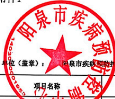
阳泉市项目支出绩效自评表